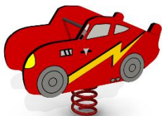
Urządzenie kołujące na sprężynie Bujak Samochód 2 | WIZUALIZACJA

PLACE ZABAW | ALTANY | DOMKI | MEBLE OGRODOWE | ŁAWKI PARKOWE | DREWUTNIE www.marpis.pl