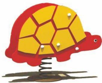
Urządzenie kotyszące na sprężynie Bujak Żółw WIZUALIZACJA

PLACE ZABAW | ALTANY | DOMKI | MEBLE OGRODOWE | ŁAWKI PARKOWE | DREWUTNIE www.marpis.pl