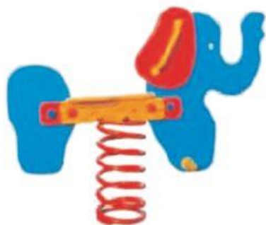
BUJAK SŁONIK | WIZUALIZACJA

PLACE ZABAW | ALTANY | DOMKI | MEBLE OGRODOWE | ŁAWKI PARKOWE | DREWUTNIE www.marpis.pl