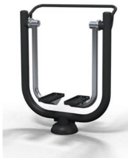
Render poglądowy urządzenia