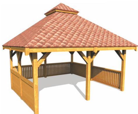
Wizualizacja | Altana Biesiadna 460 x 460